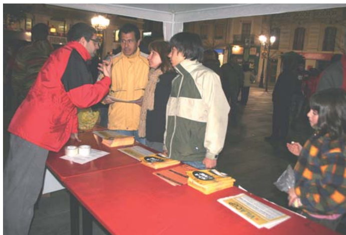
La CUP donant explicacions als veïns

Per la CUP hi ha motius mediambientals que impacten el territori ja que les 11a es troben entre la riba del Pertegàs i el Parc Natural del Montseny, els Maribaus, que és la darrera àrea de transició entre el nucli urbà i el Montseny. Expliquen que es tracta d'una zona amb un alt interès natural, agrícola i paisatgístic per Sant Celoni i actualment fa la funció de lleure i oci de molts celonins, que permet un contacte directe amb la natura, tot evitant l'efecte barreira que l'AVE i la resta d'infraestructures causen al municipi.