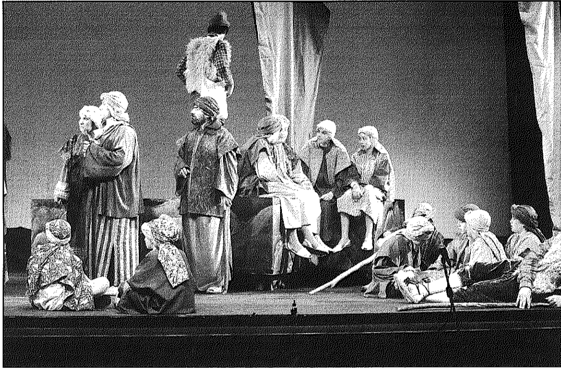
Un dels quadres de Els Pastorets d'Horitzó Teatre de Sant Esteve de Palautordera (L'ADBM)

La companyia representarà l'obra el 26 i 28 de desembre i l'ú de gener