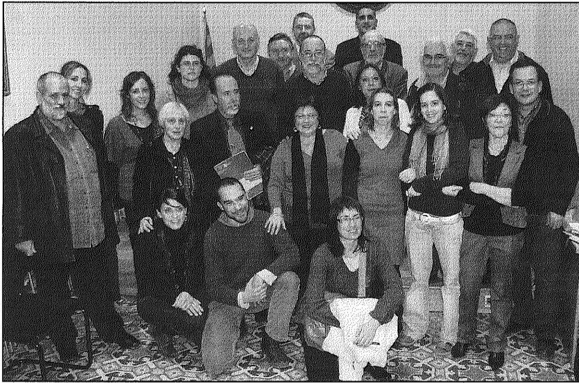
Alcaldes, regidors i tècnics que participen al projecte Tritó del Montseny

Dos dels elements que es van destacar pel bon funcionament del Tritó fins al moment van ser, precisament, la transversalitat del projecte i la qualitat dels tècnics que hi participen, també presents a la signatura. Deulofeu va assenyalar que amb el nou conveni es pretén marcar nous horitzons per al projecte, com la constitució d'un observatori que permeti disposar d'una base de dades