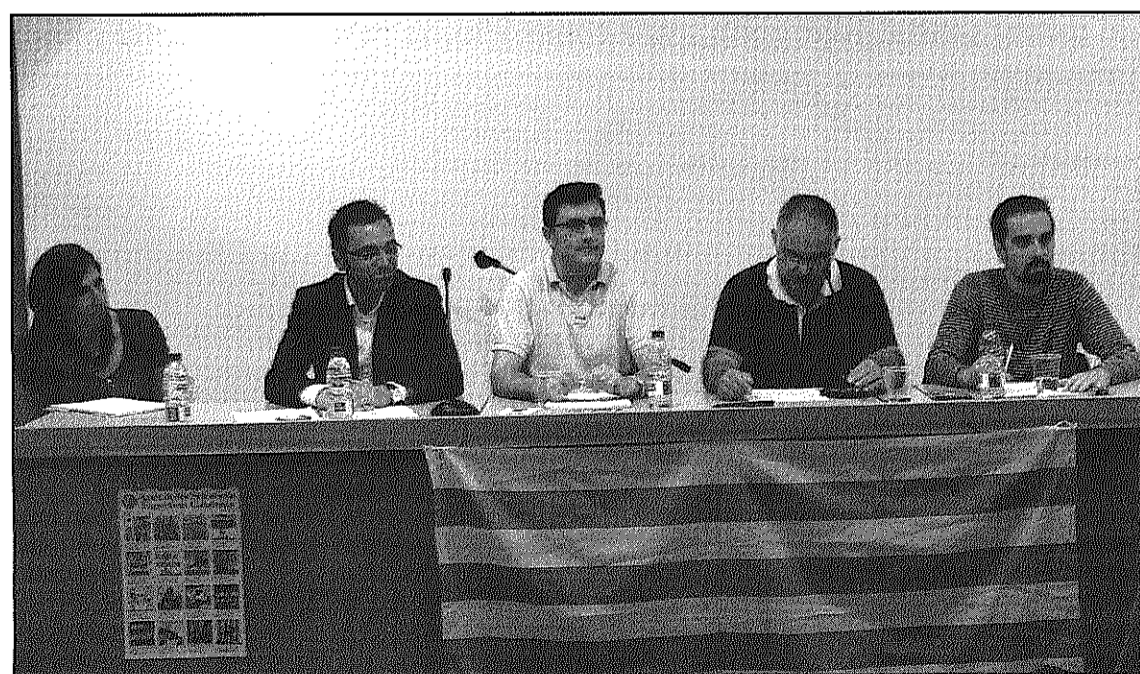
El primer debat realitzat per l'entitat, entorn a les seleccions esportives nacionals (L'AJBM)

El debat se celebra avui, divendres, a dos quarts de 9 del vespre a la biblioteca