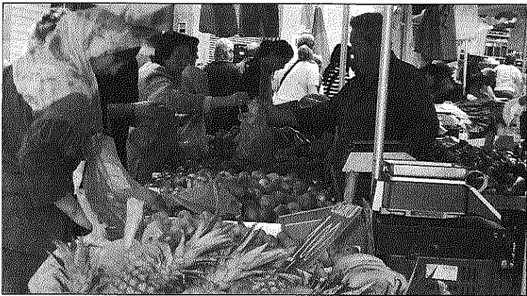
La encuesta sobre el mercado está abierta hasta el día 30.

D esde el Área de Comercio del Ayuntamiento de Santa María de Palautordera, conjuntamente con los agentes sociales implicados, se está trabajando para modernizar, optimizar y mejorar el mercado semanal que cada sábado por la mañana se celebra en Palau. Por este motivo, se ha iniciado un proceso participativo abierto a todos los vecinos a través de una encuesta que se ha colgado hasta el próximo 30 de noviembre en la página web municipal. Quien quiera participar del proceso y expresar su opinión deberá responder a cuestiones relacionadas con la ubicación del mercado, la distribución y ordenación, la imagen de las paradas, posible ampliación, la afluencia de público, la cantidad y variedad de los productos puestos a la venta,