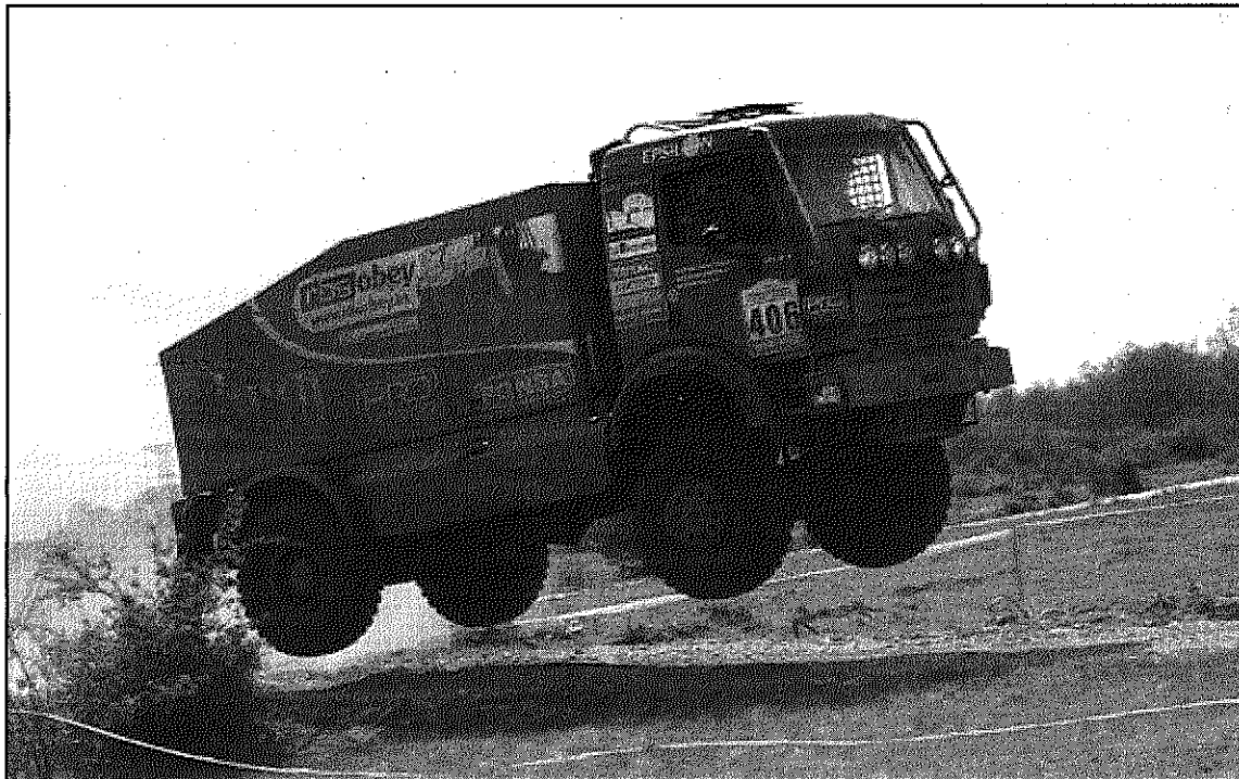
Un dels vehicles de l'Epsilon Team de Cardedeu (L'AdBM)