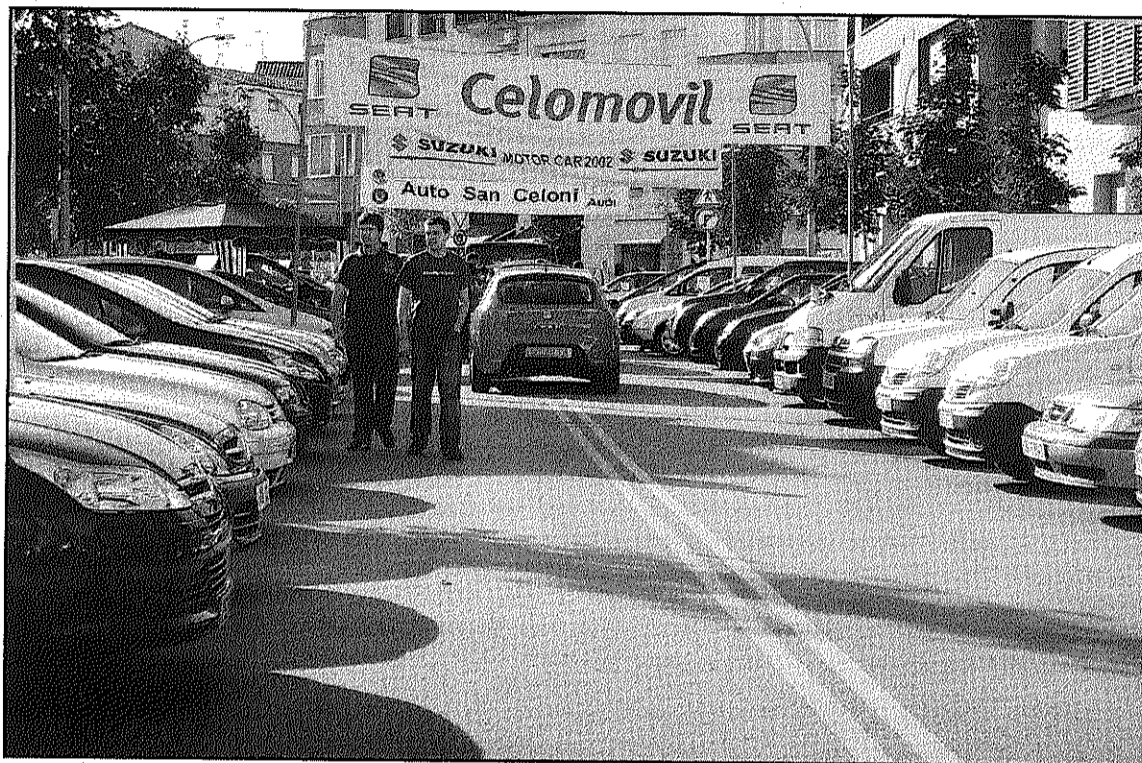
La Fira del Vehicle d'Ocasíó marxa del carrer Esteve Cardelús per situar-se al polígon

A pocs dies de la celebració de la Fira, alguns dels participants van optar per canviar-la de lloc, esgrimint la manca d'espai a la seva ubicació habitual. De fet,