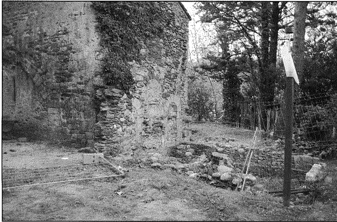
Imatge d'un dels fanals trencats i les tanques destrossades a les excavacions de la Rectoria