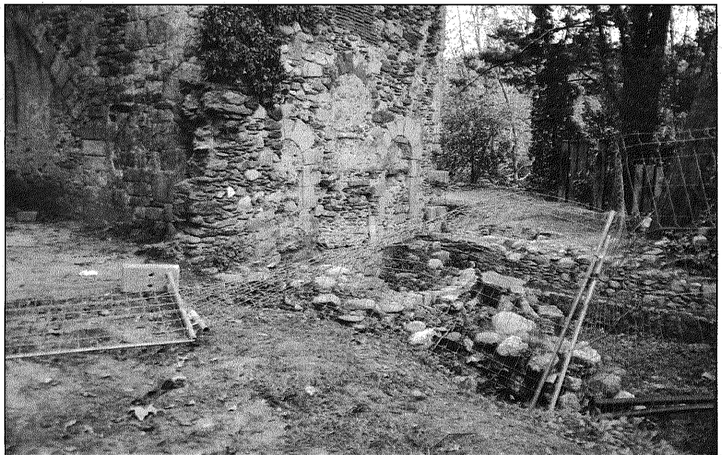
Els brètols van llançar ampolles de vidre i altres deixalles contra les restes arqueològiques de la Rectoria Vella (L'AgBM)

Després de l'estàtua de Montané, la nit de dissabte s'enceben contra restes arqueològiques a Sant Celoni (Pàgina 7)