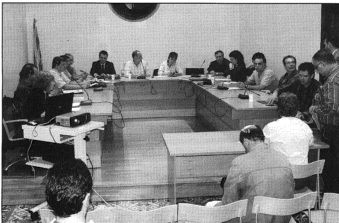
El Ple de l'Ajuntament va aprovar un Reglament d'habitatges desocupats a Sant Celoni