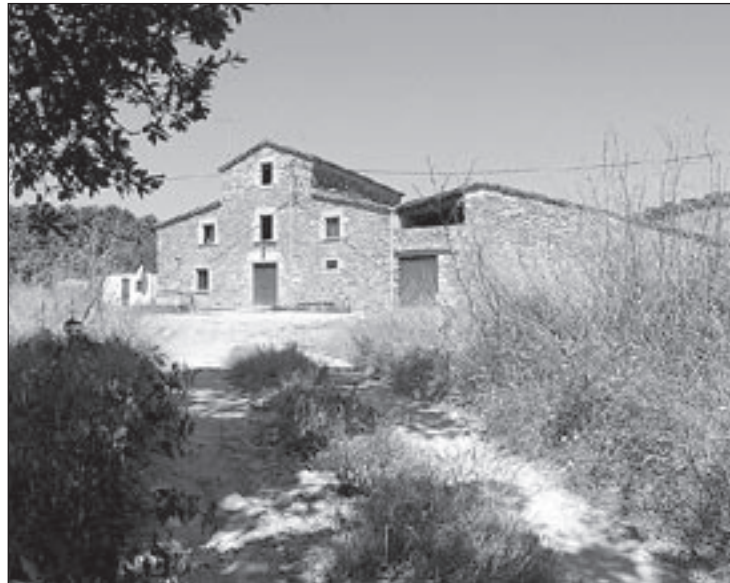
Una imatge de Can Riera de l'Aigua, on està previst fer l'ARE

abans de Nadal, partits polítics, però també ciutadans i agents socials van poder mostrar la seva posició respecte al projecte.