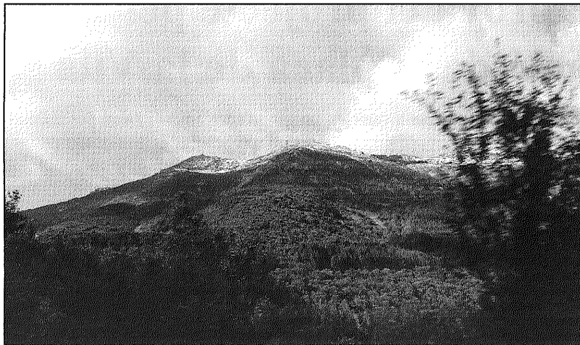
El document estableix els límits del parc, els usos i els graus de protecció del seu entorn (L'AdBM)

El Pla comporta incrementar 1.700 hectàrees la superfície actual del Parc