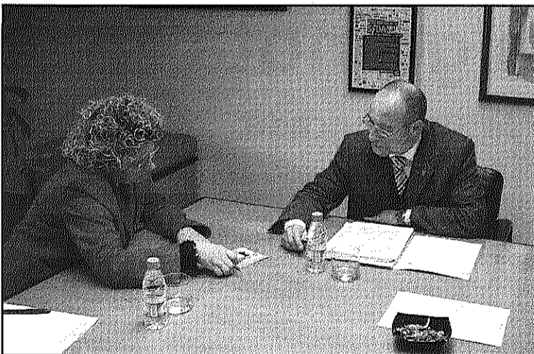
Geli i Deulofeu en una reunió entorn al nou hospital (L'AdBM)

REDACCIÓ. Sant Celoni Avui, divendres, a tres quarts de 12 del migdia, se celebra l'acte inaugural del TAC d'alta tecnologia de l'Hospital de Sant Celoni, amb la presència de la consellera de Salut, Marina Geli, a la que acompanyaran les autoritats locals.