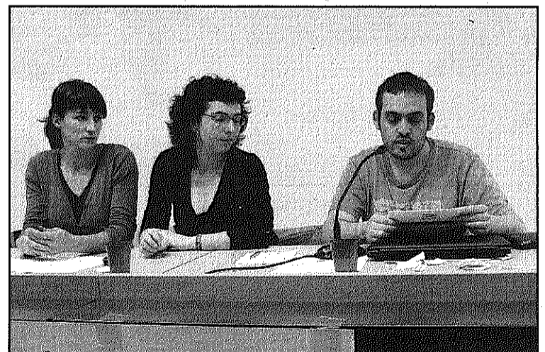
La CUP considera que falten habitatges assequibles (L'AdBM)

En aquest sentit, la CUP considera que existeixen alternatives