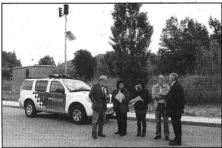
Una imatge de la última prova de sirenes realitzada

REDACCIÓ. Sant Celoni/ La Batllòria Avui, divendres, es realitzarà una nova prova de les sirenes d'avís d'accident químic de Sant Celoni i la Batllòria previstes al Plaseqcat (Pla d'emergència exterior del sector químic de Catalunya). Es preveu que el simulacré comenci puntualment a les 11 del matí i que finalitzi uns 10 minuts més tard per tal de comprovar que el so amb què arriba l'avís a tots els punts amb risc potencial de ser afectats per un accident químic és de prou intensitat. La prova també busca que la població de la zona inclosa al Plaseqcat es familiaritzi amb l'alarma perquè els veïns de la zona puguin prendre les mesures