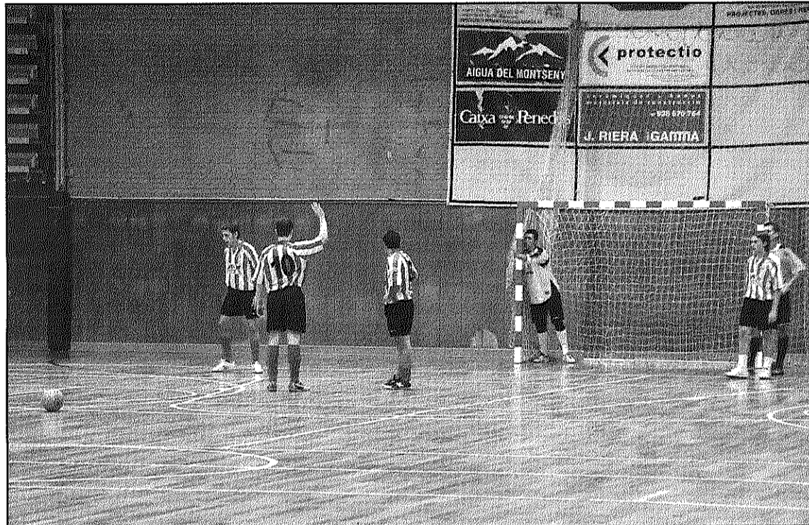
El FS Sant Celoni jugarà aquest dissabte a casa com a líder del seu grup (L'AdBM)

L'equip va golejar 3-6 al Natació Sabadell i aconseguix encapçalar el grup