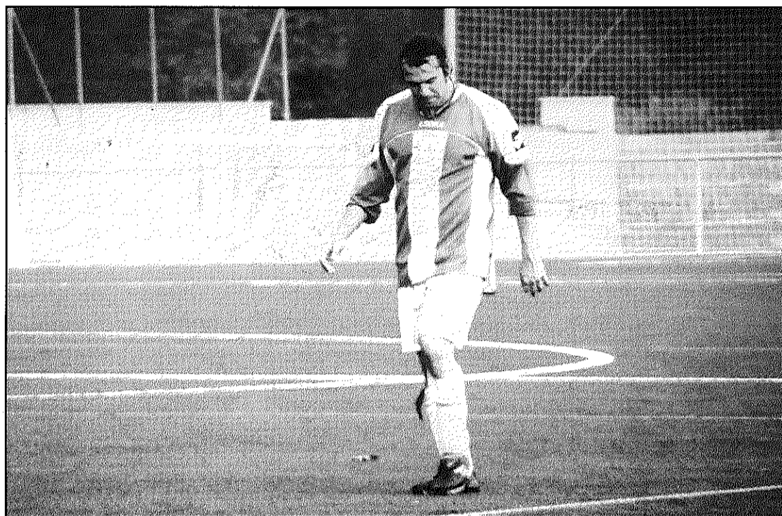
El CD Inacsa no acaba de trobar la línia de bons resultats (L'AGBM)

Pel que fa al CD Inacsa, els de la Batllòria venen de donar-ne