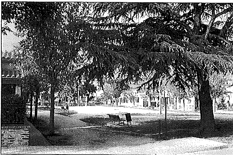
La plaça presenta actualment una imatge de deixadesa i el parc infantil està en mal estat

Segons Lechuga, la situació es veia agreujada, a més, pel fet que els veïns tenen les habitacions a tocar de la plaça i això feia que les molèsties fossin més elevades. "Ara anem fent controls a la zona i estem en contacte amb els veïns amb qui consensuarem les mesures a adoptar a la plaça", assenyalava la regidora. Lechuga assegura que, en condicions normals, "amb aquesta plaça més endreçada això no passaria". A la inseguretat s'hi sumen altres factors, com el fet que alguns vehicles arriben a aparcar a l'interior de la plaça.