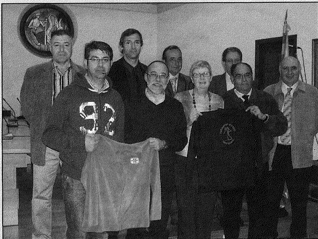
Una imatge de la presentació de les tres empreses patrocinadores del club al Mundial (L'AdBM)

J.L.E. Sant Celoni A diferència de l'any passat a Austràlia, el CP Sant Celoni compta per a aquest compromís a Xina amb un pressupost ajustat que dona una certa tranquil·litat als seus responsables. D'una banda, perquè l'equip està format per menys