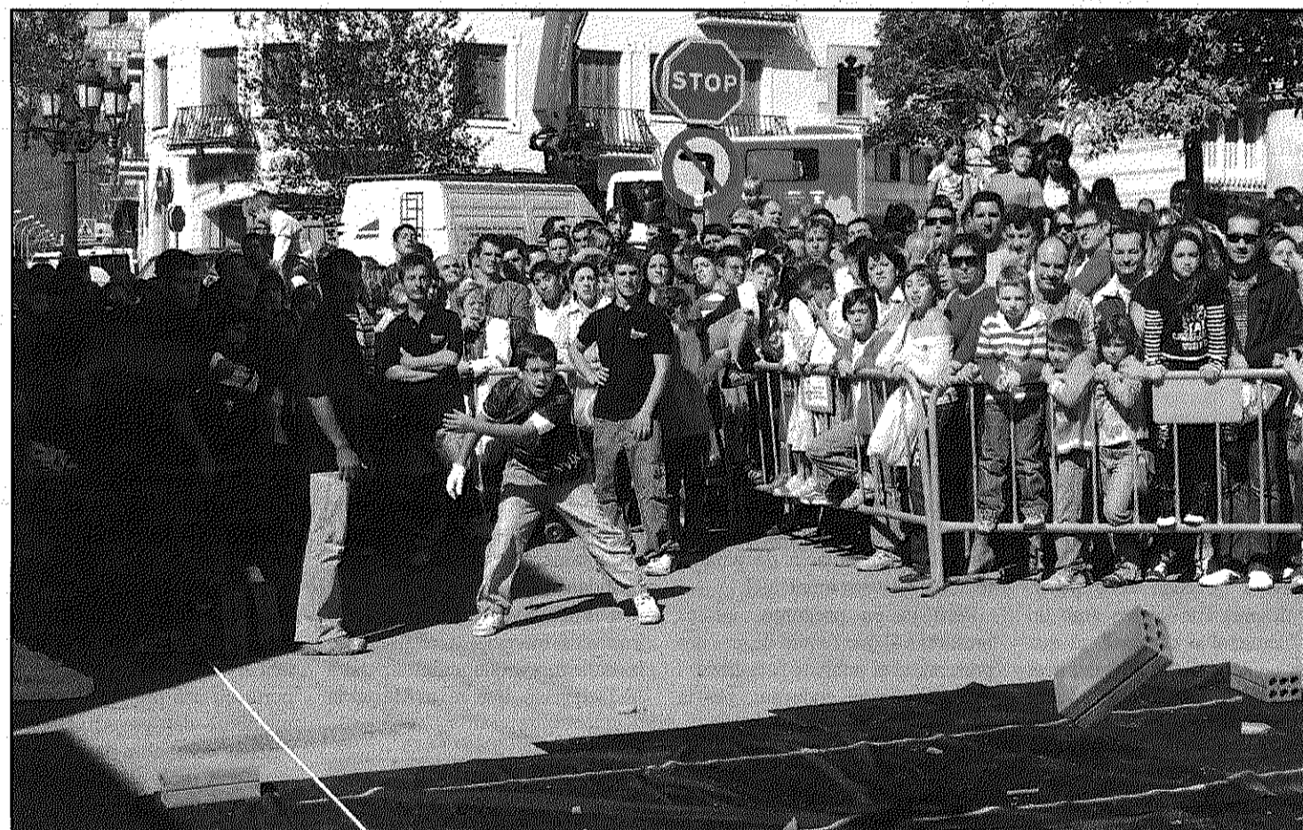
El concurs de llançament de totxanes es repetirà després de l'èxit que va tenir l'any passat la primera edició (L'AdBM)

El nou espai cultural de la Quadra, l'Envelat i les Barrakes acolliran els concerts i actes culturals (Pàgines 19 i 20)