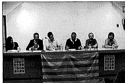
Una imatge de la taula sobre seleccions esportives catalanes