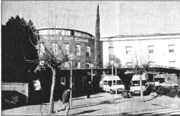
El ferits van ser traslladats a l'Hospital de Sant Celoni amb ferides diverses

Es dona la circumstància que els tres ciclistes, que anaven amb bicicletes mountain bike per fer un recorregut de muntanya, havien decidit fer només aquell tram de carretera per estalviar un tros de camí. Tots tres acostumen a sortir junts de manera habitual per practicar aquest esport i són