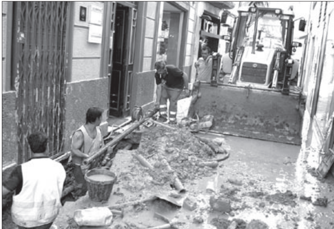
Va caldre la intervenció d'una excavadora per obrir una rasa i arribar al punt on hi havia la fuga