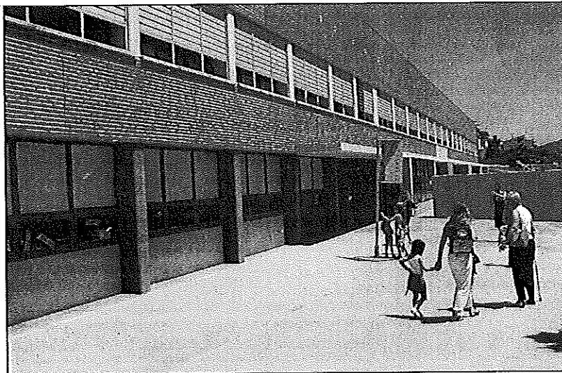
Una imatge de l'escola la Tordera, mancomunada entre Sant Celoni i Palautordera

Part de l'alumnat ha començat les classes amb canvis al seu centre, com el del CEIP Soler de Vilardell o de l'escola Pallerola, ja que les obres que s'hi estaven desenvolupant estan gairebé completament acabades. En concret, al Soler de Vilardell s'ha arranjat el paviment, els instal·lacions, els lavabos i l'escala d'accés a la primera planta. Per aquest curs, acollirà un grup més d'alumnes que l'any