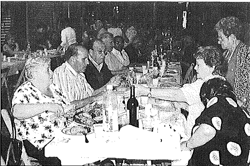
Una imatge del sopar a l'aire lliure celebrat a l'edició passada de la Festa de la Vilanova

Per cloure la tarda d'activitat, a dos quarts de 6 de la tarda s'oferirà una xocolatada per benedir i, seguidament, a les 6, se celebrarà el rosari a la capella. Ja al vespre, al voltant de dos quarts de 9, els veïns del barri, els amics i els convidats agafaran posició a les llargues taules que cada any es disposen a Major de Dalt pel sopar de germanor.