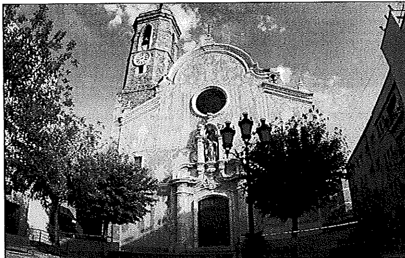
Els visitants podran accedir al campanar de l'església per gaudir d'una singular vista

La segona de les passejades guiades sortirà diumenge, també a les 6 de la tarda, de l'església parroquial de Sant Martí. Aquesta tindrà com a eix "L'església parroquial de Sant Martí i l'esplendor del barroc". L'itinerari s'inicia a la magnífica façana amb decoració esgrafiada barroca, que data del 1762, segueix per l'interior del temple i acaba amb la pujada al campanar que permet gaudir d'unes vistes