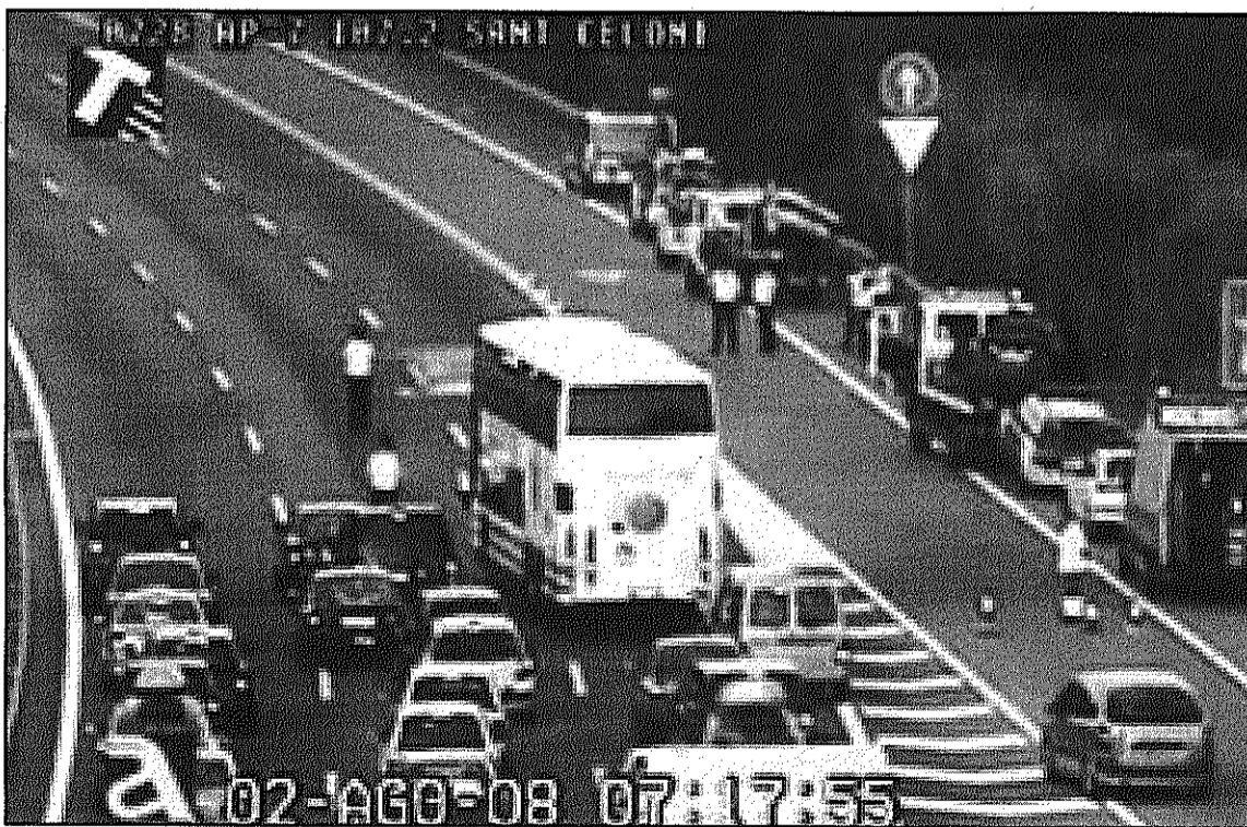
Imatge de l'accident presa per la càmera de control de trànsit del Servei Català del Trànsit (L'AdBM)

Al lloc de l'accident s'hi van desplaçar fins a cinc dotacions de bombers i tres grues, ja que les