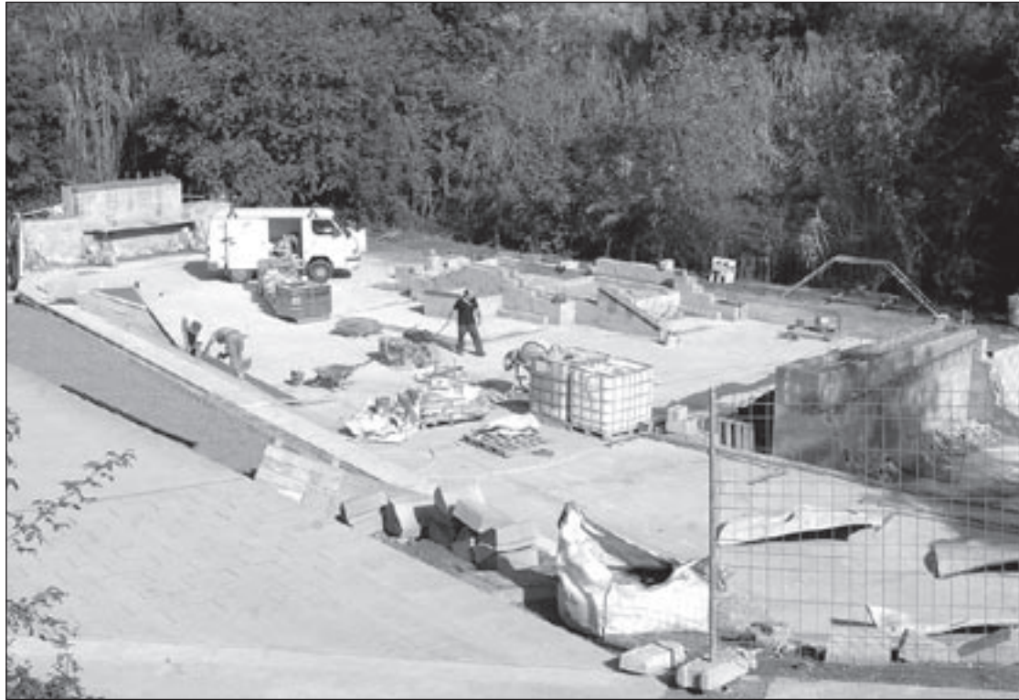
Aquests dies s'estan enllestint les obres del parc d'activitats a la zona del Pertegàs

En el projecte hi ha col·laborat el Centre Excursionista de Sant Celoni, que ha fet importants aportacions en el disseny de la zona de «boulder» per a la pràctica d'escalada. També hi han participat joves «skaters» de la vila en la projecció de l'espai de «skateboard», que finalment ha quedat distribuït en una pla-