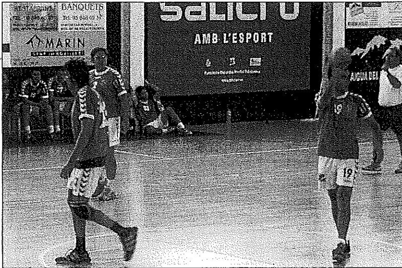
L'Handbol Palautordera Salicru mantindrà la base de la plantilla de l'any passat

L'altra novetat és que el segon equip sènior que juga a Tercera catalana passarà a denominar-se Handbol Sant Celoni-Palautordera com a resultat de la fusió entre els dos equips atesa la manca d'efectius amb què comptava el primer conjunt celoni. Això no