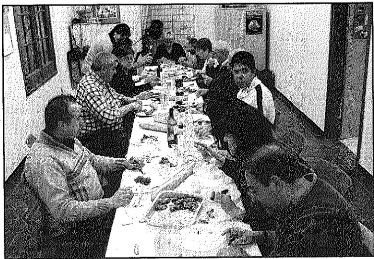
Una de les trobades de la recent associació astronòmica (L'AdBM)

REDACCIÓ. La Batllòria La Batllòria comença la Festa dijous amb una activitat vinculada amb una de les entitats de nova creació a la població: l'associació astronòmica-gastronòmica de la Batllòria. En aquest sentit, dijous, 21 d'agost, a les 7 de la