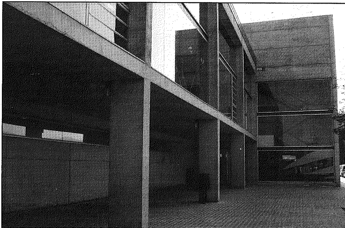
Fins demà, 16 d'agost, es faran treballs de manteniment a l'única piscina del municipi (L'AdBM)

El tancament del Centre Municipal d'Esports del Sot de les Granotes coincideix, a més, amb la temporada de 'portes obertes' que es va posar en marxa des de l'inici d'estiu i que es preveu mantenir fins el 30 de setembre. En aquest període, el centre ofereix la possibilitat d'accedir al recinte tant als abonats com als que no ho són, establint unes tarifes especials, més reduïdes, per a la utilització dels serveis de