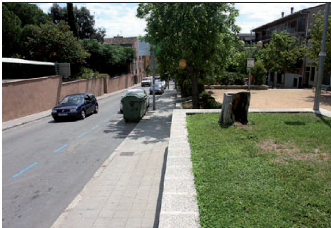
L'Ajuntament preveu construir l'aparcament sota la plaça Comtes del Montseny, a tocar del centre de Sant Celoni