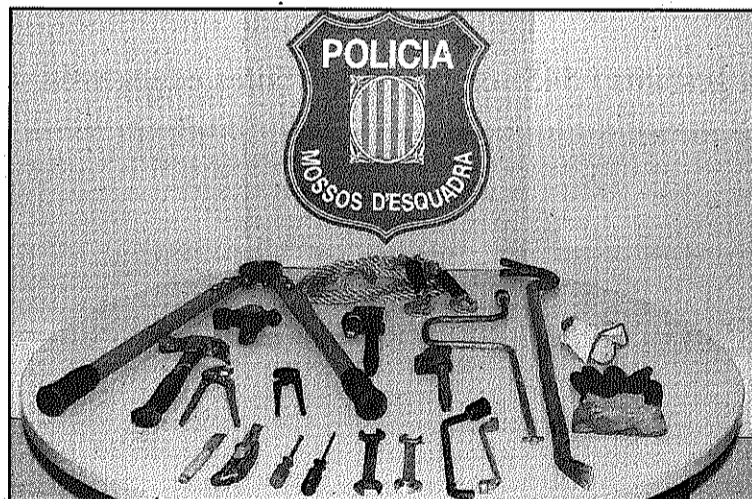
Una imatge de les eines confiscades al detingut

Actualment la investigació es troba en mans de l'ABP de Granollers, que no descarta més detencions pels robatoris a l'em-