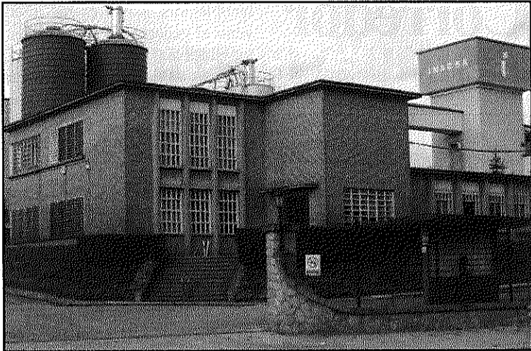
Els lladres van tallar les reixes del perímetre

REDACCIÓ. La Batllòria La nit de dimecres a dijous, uns desconeguts van entrar a l'empresa Inacsa de la Batllòria d'on es van emportar material de la factoria. Els fets es van descobrir ahir, dijous, al matí, i es va cursar la denúncia als Mossos d'Esquadra que investiguen l'autoria del