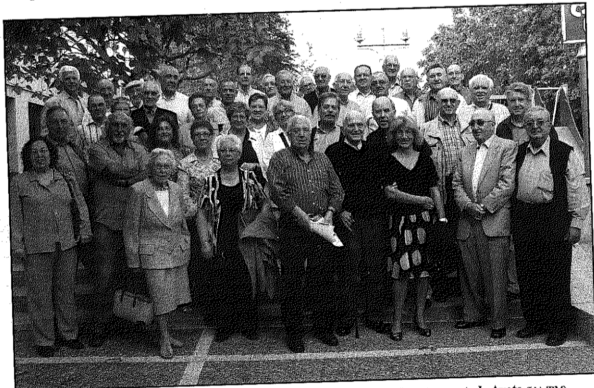
Una imatge dels assistents al dinar del dijous d'aquesta setmana al restaurant els Avets

Prop de 50 persones assisteixen a la trobada anual d'antics treballadors