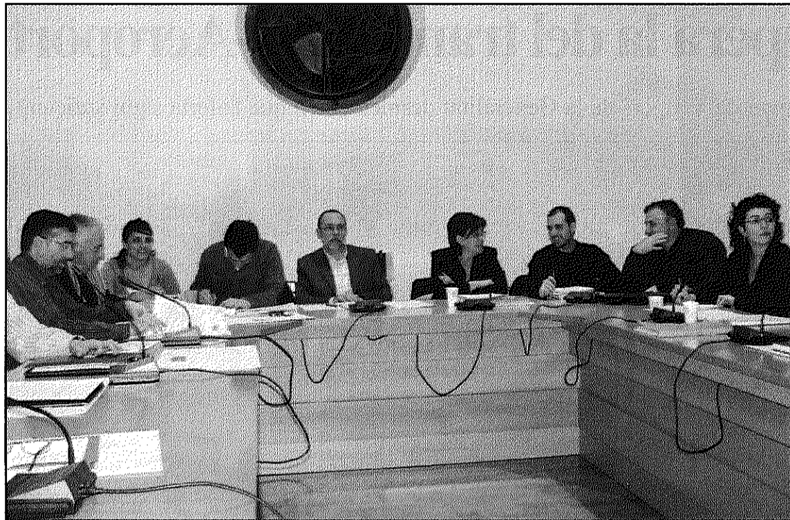
Mesures contra la crisi, les ordenances i el reglament d'habitatge desocupat, principals punts (L'AdBM)

El Ple ordinari hauria d'incorporar, també, tal i com es va acordar