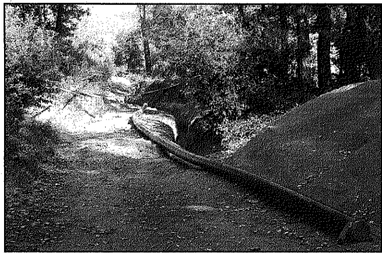
Les obres de connexió van acabar l'any passat (L'AdBM)

REDACCIÓ. Campins. L'Ajuntament de Campins ha hagut de fer us de la connexió de la xarxa d'abastament amb Sant Celoni a bastament de la situació de sequera que ha deixat la bassa sense aigua i amb molt poc cabal a la riera. La mesura s'ha pres aquest mes d'octubre, durant el