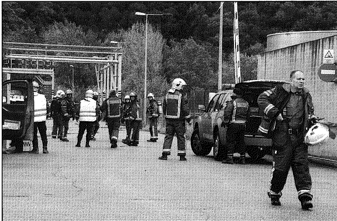
L'empresa va negar la fuga endarrerint l'arribada dels serveis d'emergència (L'AdBM)

Segons el Consistori, l'únic que es busca interposant aquesta de-