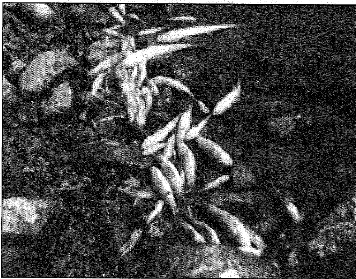
Alguns dels peixos que es van trobar morts en el tram del riu (JAVIER ROMERA)

Davant d'això, Medi Ambient va enviar a la zona un tècnic que va