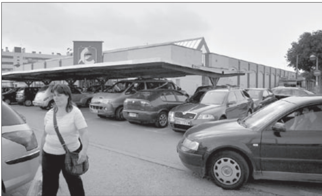
L'aparcament de l'Eroski de Riera Seca és el que nota més l'afluència de vehicles, sobretot el dia del mercat setmanal

La sentència apunta ara que no es pot provar l'autoria material dels trets, ni que fos un dels processats i tampoc que portessin armes de foc. Tampoc considera provat que els acusats s'haguessin posat d'acord per endur-se els 30 quilos d'haix que suposadament volien comprar el dia dels fets. El text remarca que alguns testimonis "no han sabut o no han volgut dir res" del que havia passat i considera les hipòtesis sobre els fets del 9 d'abril de 2005 "possibles i, fins i tot, versemblants". Amb tot, són insuficients per desvirtuar la presumpció d'innocència dels processats.