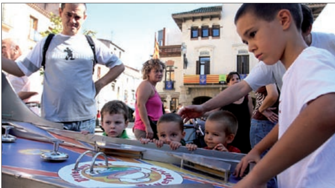
La tarda de dissabte, els més menuts van poder prendre part del segon Mercat d'Intercanvi de la Joguina

La plantada i la trobada de gegants també han estat molt especials aquest any a causa de la visita del gegant de la localitat francesa de Saint Sylvestre Cappel, que fa 4,8 metres i necessita dues persones per moure's. Amb tot, l'activitat més esperada pels petits ha estat el Correxutxes, puntuable per al Corremonts i que va acabar amb la victòria final dels Senys per un punt de diferència.