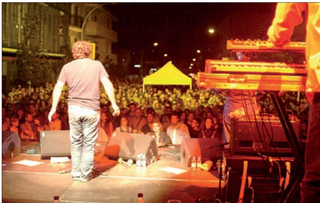
El concert d'Antònia Font ha estat sens dubte el més multitudinari de la festa major