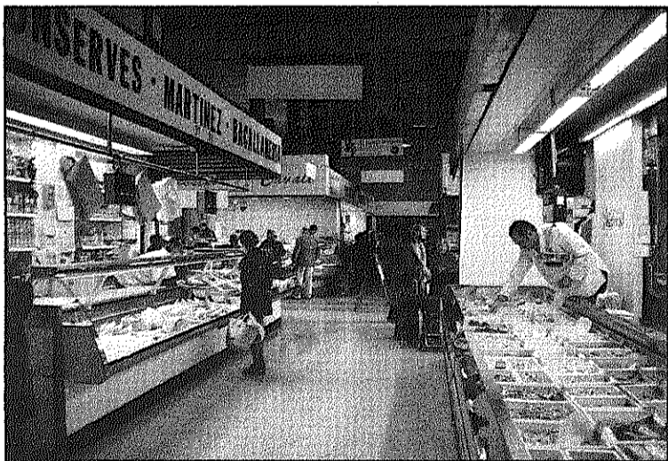
Finalitza dissabte la campanya promocional del mercat (L'AdBM)

El mercat municipal de Sant Celoni sorteja, dissabte, tres viatges a punts turístics de la costa catalana