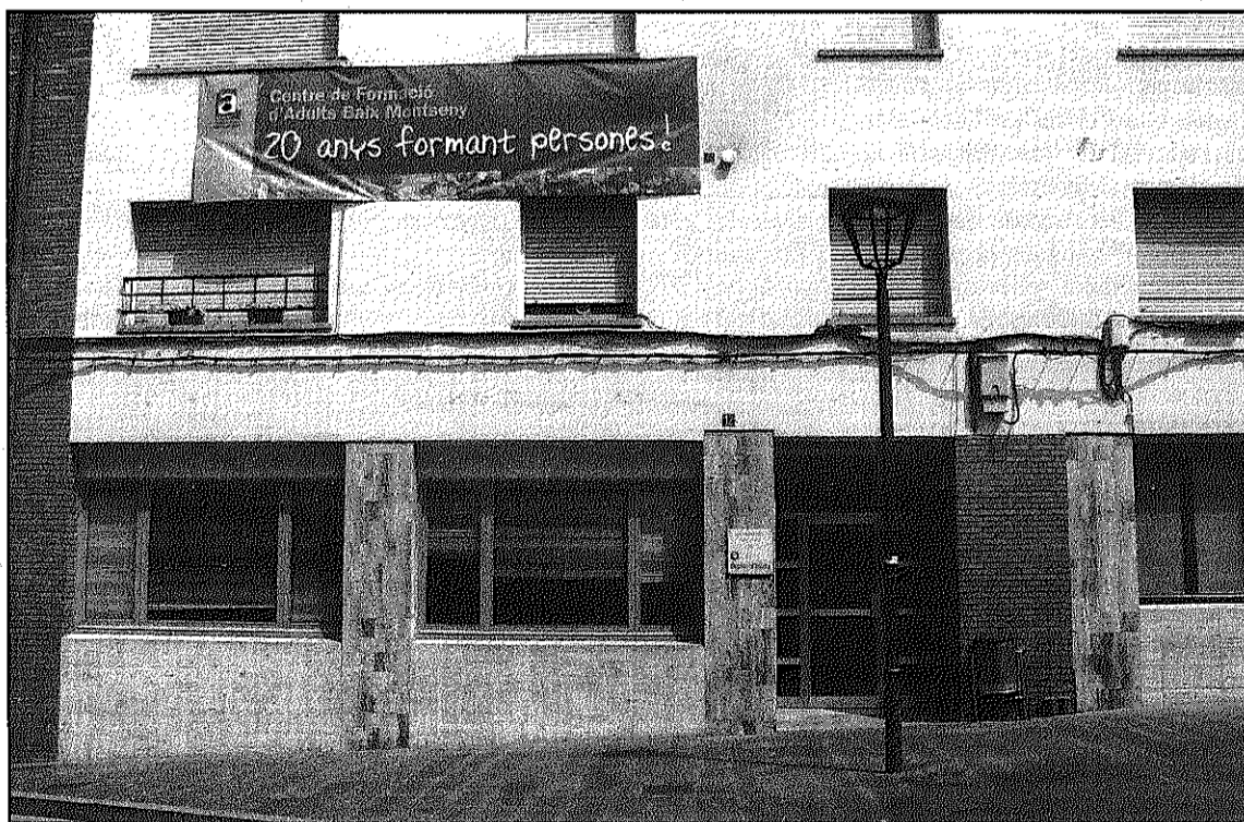
L'Escola d'Adults comptarà, a partir del setembre, amb dos nous cursos de formació (L'AdBM)

Per als cursos d'acolliment lingüístic, un total de 6, els usuaris només hauran d'abonar un 2 per cent del total del cost i l'Ajuntament el 98 per cent restant. Pel què fa a la formació bàsica, integrada per 4 cursos, els usuaris només assumiran el 5 per cent del cost, i a la formació per al món laboral, que compta amb 3 cursos, el 35 per cent. Només en els cursos de formació complementària, dels que l'Escola d'Adults n'ofereix dos, els inscrits pagaran més de la meitat del curs, en aquest cas el 65 per cent.