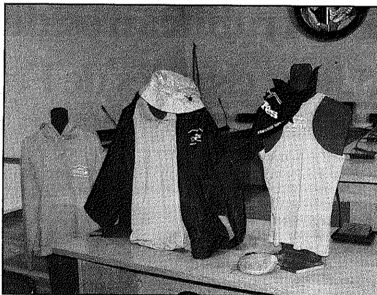
Samarretes de tires, polos, cangurs i dessuadores, novetats (L'AdBM)

La paradeta romandrà oberta de dilluns a divendres de 6 a 8 de la tarda, dissabte, 6 de setembre, d'11 del matí a 1 del migdia i de 6 a 9 de la tarda i diumenge al matí.