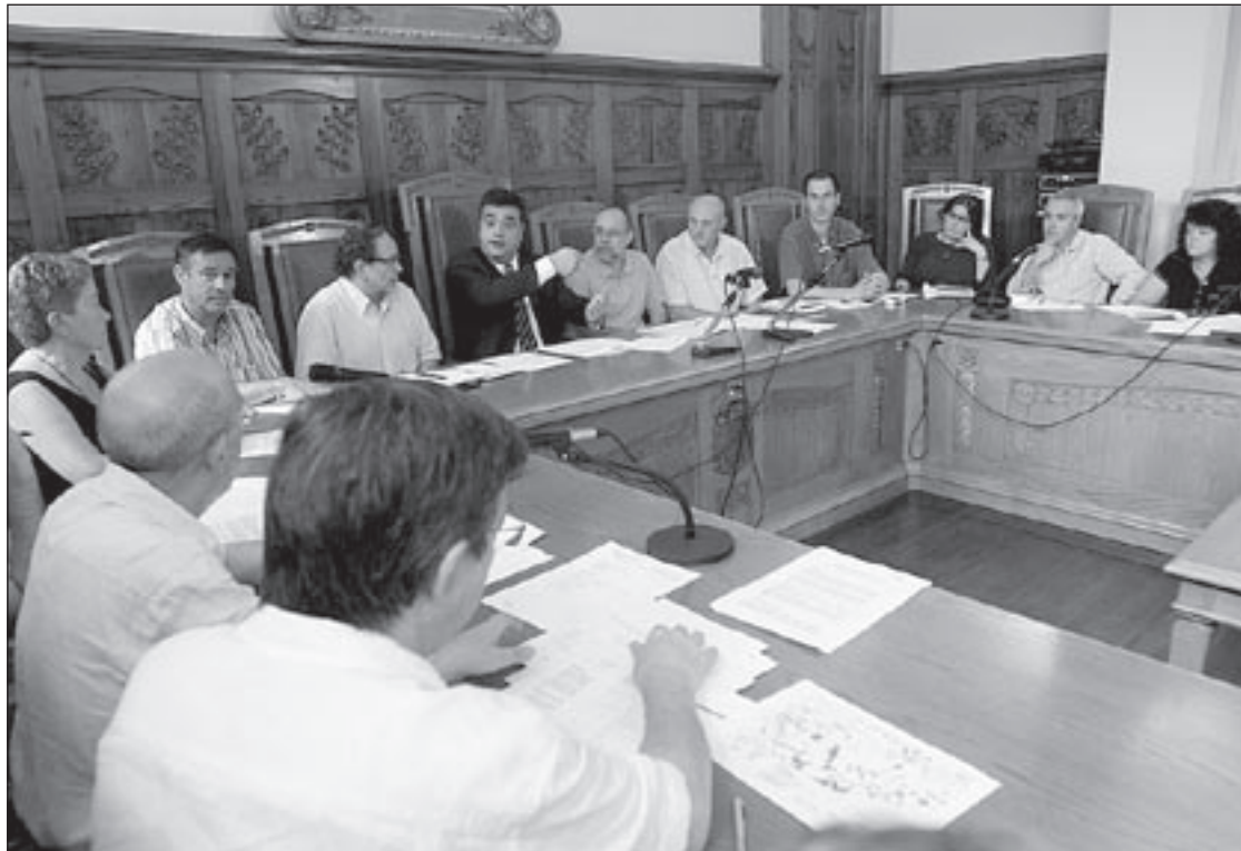
A la reunió de dimecres, hi van assistir els alcaldes de set municipis de la comarca i regidors d'altres