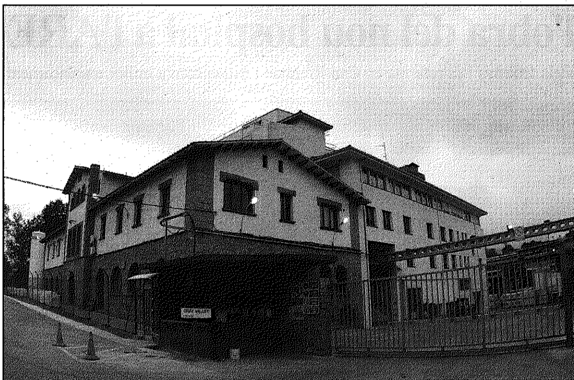
Cray Valley traslladarà la producció de polièster saturat líquid a la planta de Sant Celoni (L'AdBM)

La companyia preveu traslladar la totalitat de la divisió de polièster insaturat a Miranda de Ebro, tancant la secció de Sant Celoni que, fins al moment, actuava com a complement de la planta burgalesa. El tancament de la divisió es compensarà, per contra, amb l'entrada de nous productes, com el polièster saturat líquid que fins al moment es fabricava en poca quantitat a Mollet. L'objectiu de l'empresa és traslladar fins al 70 per cent de la fabricació dels productes de tota la multinacional a Sant Celoni en un termini aproximat de dos o tres anys. El nou pro-