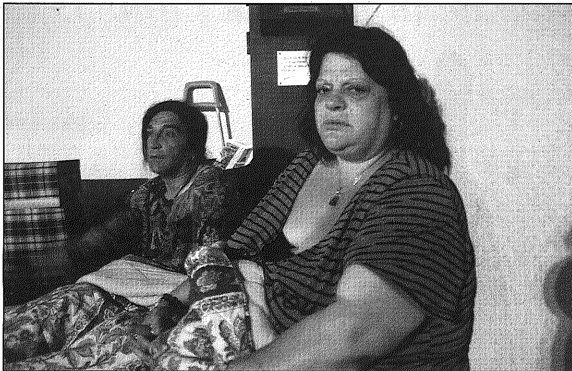
La parella, dimarts a la nit, davant a la Biblioteca de Sant Celoni on dormien

L'Ajuntament assegura que ha desplegat els mecanismes de serveis socials