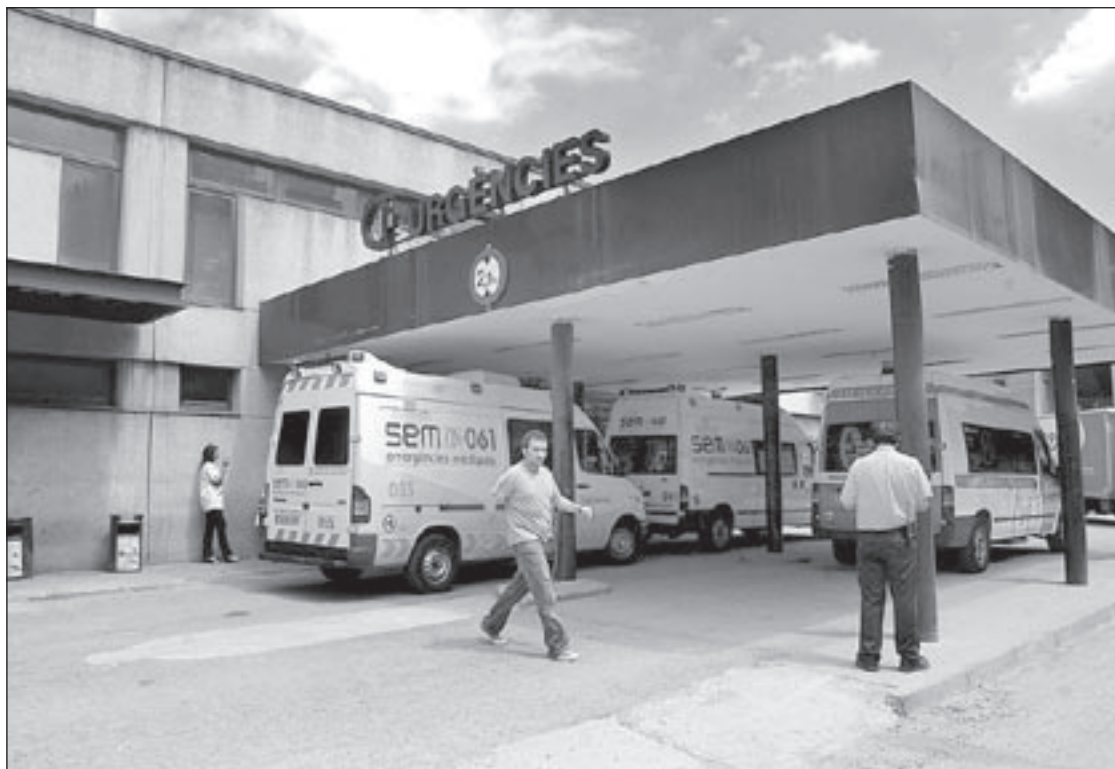
El servei d'urgències de l'Hospital s'ha ampliat en tres llits per poder atendre millor els pacients

L'increment de llits a Urgències permetrà pal·liar, només en part, però, el dèficit de llits hospitalaris a la comarca, degut al creixement demogràfic dels darrers anys i al tancament de Policlínica. Segons el director mèdic de