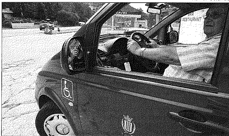
El taxi está al servicio de los vecinos desde el lunes.

Desde esta semana y durante aproximadamente un mes y medio los vecinos de Tagamanent dispondrán de un servicio gratuito de taxi para cruzar la autovía C-17. La razón de este servicio que permitirá hacer un desplazamiento de no más de cincuenta metros en línea recta son las obras que afectan a esta vía y que obligará a cortar el paso subterráneo que comunica las dos partes de la población. Con estas obras los vecinos que se desplazan a pie no podrían cubrir de forma segura este corto tramo sin dar un largo rodeo. Concretamente, igual que los automovilistas, deberían dirigirse hacia las zonas donde existen otros pasos subterráneos, o los lugares en las que es posible cruzar. La presencia de las obras así como de nuevas barreras co-