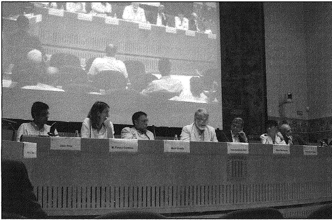
L'acte de presentació del llibre a la sala Prat de la Riba de l'Institut d'Estudis Catalans