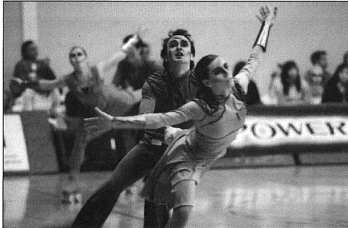
Un moment de la representació del xou del CP Sant Celoni

El CP Sant Celoni marxa dimarts a Brasil per disputar el Campionat de xous