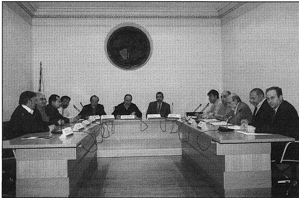
Una imatge de la signatura de l'acord pel transport públic al Baix Montseny (L'AdBM)

Els primers contactes mantinguts amb Transports aquesta setmana, explica el regidor, apunten que la Generalitat està disposada a incrementar les freqüències de pas proposades inicialment i a